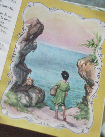
Fig. 10. — Coste che si legge in figura.

la mucca... Avviati lentamente verso casa. Fra un'ora la mamma ti darà pane e pesci. — Tu sì che fai una bella vita; — esclamò Michele — aiutami a sciogliere la vite. — Meritesti che ti lasciassi stovigliare da solo — disse Beniamino; però tirò più vicina la mucca recalcitrante, per poter allentare la corda. — Grazie, — disse Michele — e non dimenticati di riferire quella cosa di cui ti ho incaricato. — Non sarà possibile. — Però l'hai promesso. Hai gridato forte e adirato: « Lo prometto ». Una promessa vale, anche se è fatta nell'ira. — Michele, — disse Beniamino tetro — tu non sai di che cosa discorrono i grandi. — Parlano di un uomo che si chiama Gesù. Egli dice alla gente quello che fanno male e come possono farlo meglio. Basta che si cambiano. È una cosa facilissima. — Come fai a saperlo? — Io so tante cose — disse Michele. — Siedi, Beniamino, e parlami ancora di Gesù.